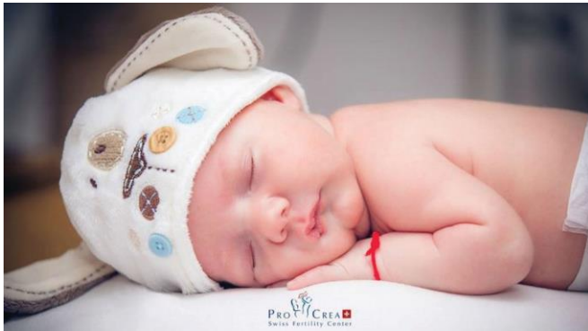
164 bimbi nati al 31.12.2017