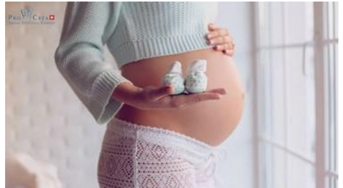
117 bimbi in arrivo

OVODONAZIONE PERCENTUALI DI SUCCESSO 2017