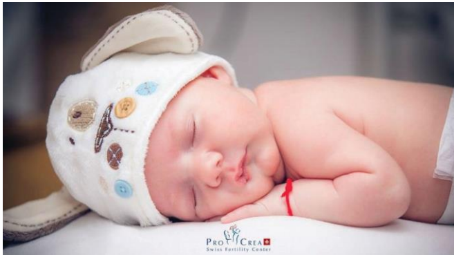
258 bimbi nati al 31.12.2018